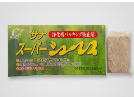
シーディング剤の一例